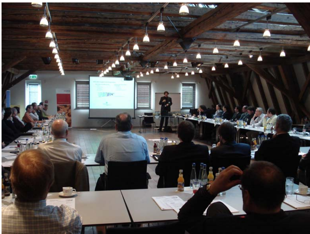
Abb.: 1. Identity Management Symposium 2008 in Karlsruhe-Ettlingen (Buhlsche Mühle)

Die Buhlsche Mühle in Karlsruhe-Ettlingen war am 22. und 23. April Ort eines zweitägigen Experten-Symposiums zu Fragen des „Identitäts-Managements“, der effizienten Organisation von Zutrittsberechtigungen und Datenzugriffen von Mitarbeitern in Unternehmen und Behörden. Zahlreiche große und mittelständische Unternehmen waren vertreten, darunter Verantwortliche von BASF, Bosch, Deutscher Rentenversicherung, Evonik und RWE, daneben Hochschulen und Forschungseinrichtungen, die ihre praxiserprobten Konzepte präsentierten.